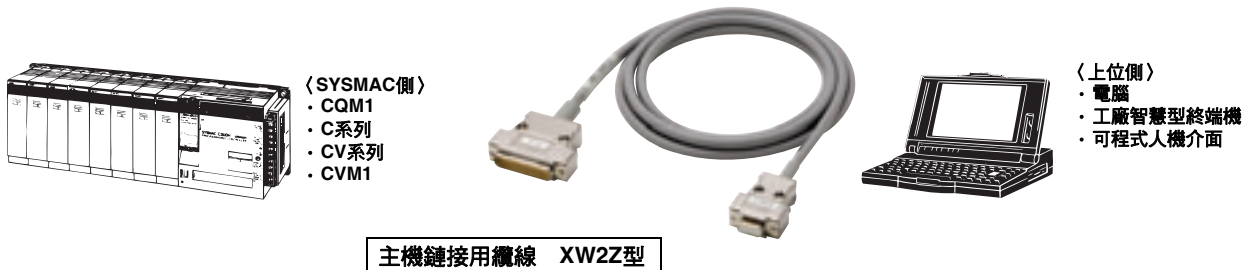
主機鏈接用纜線 XW2Z型